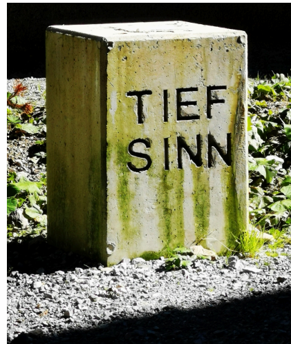
Die Stiftung Tiefsinn bezweckt, Härtefällen unbürokratisch und schnell zu helfen.